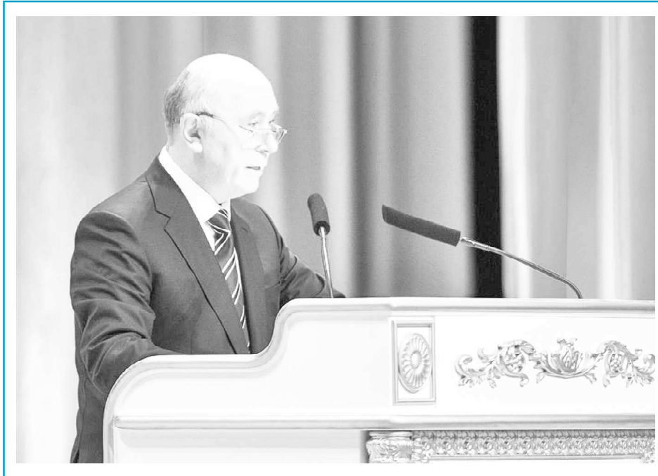
«Мы выстояли и сохранили основу для благополучия людей на десятилетия вперед»

«Нам пришлось в эти два года биться за каждый рубль, чтобы выполнить социальные обязательства перед людьми, выполнить указы Президента, сохранить соци-