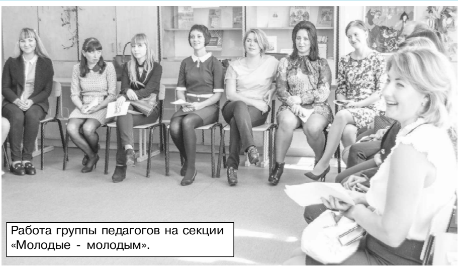
Работа группы педагогов на секции «Молодые - молодым».