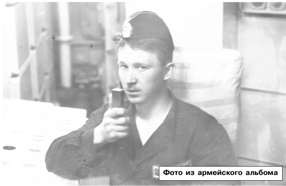
Фото из армейского альбома