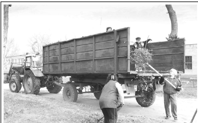
На снимке: рабочие сельского поселения Пестравка занимаются уборкой и вывозом мусора по ул. Крайнюковской.

Главам сельских поселений также необходимо срочно приступить к ямочному ремонту дорог по улицам и переулкам сел, навести порядок на